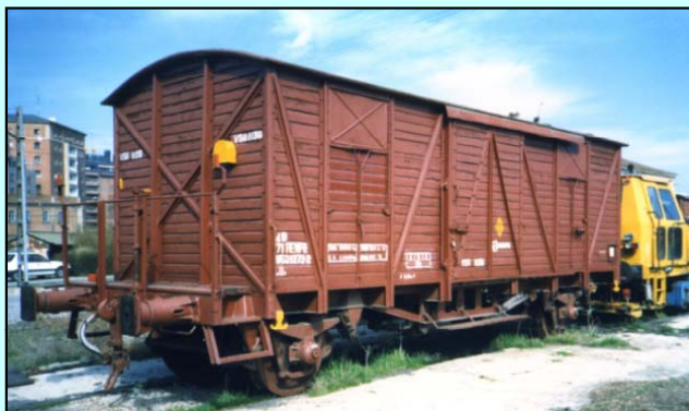
Vagón VSO-1139 propiedad de ASVAFER

El vagón conmemorativo del Congreso será un modelo del vagón taller matriculado como VSO-1139 , con número UIC 40 71 952 1272-2 .Us y que tuvo anteriormente la matrícula J-306.664 . Fue construido en 1961 en Talleres Miravalles (Vizcaya) y actualmente es propiedad de ASVAFER . El modelo llevará la inscripción conmemorativa en el techo y se suministrará un techo liso intercambiable.