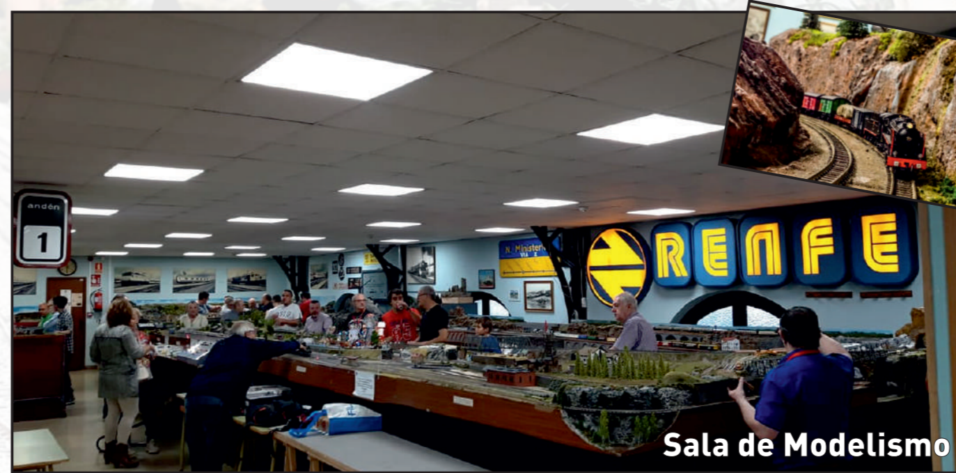
Sala de Modelismo

Nuestra Asociación dispone de un amplio local social cuya distribución permite a nuestros socios disfrutar de todas las actividades que realizamos. Incluye desde sala de proyecciones hasta sala de maquetas, pasando por una gran biblioteca.