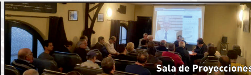
Sala de Proyecciones